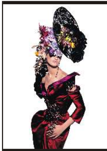
Tyen N° 2