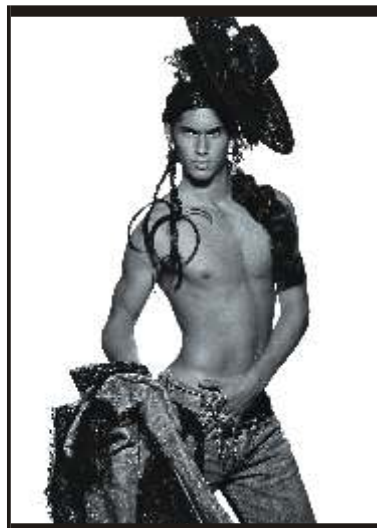
Tyen N° 5