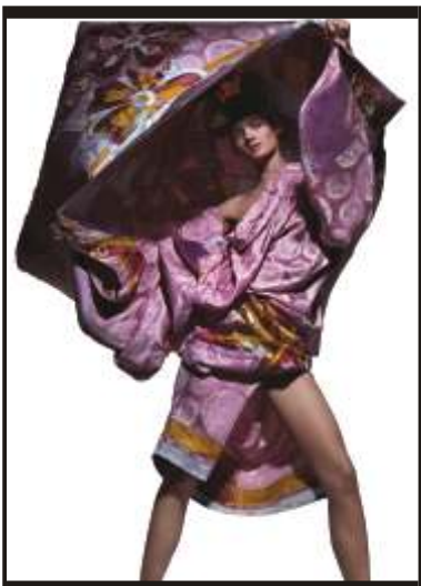
Tyen N° 4