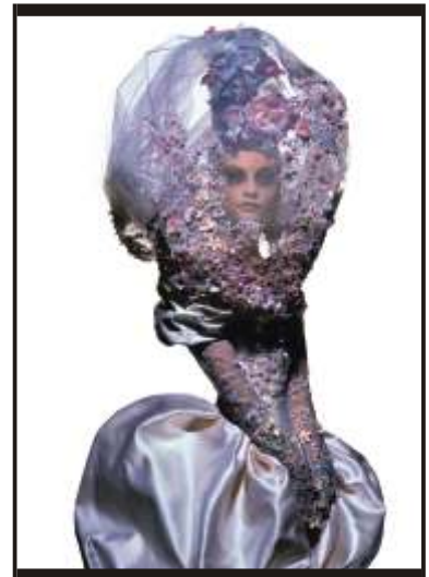
Tyen N° 3