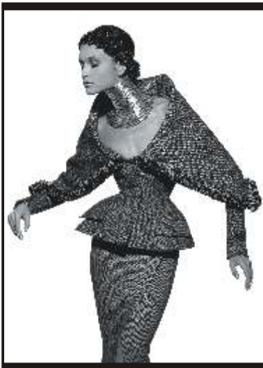
Tyen N° 1

E-mail : tordjman.ruth@free.fr Download the press informations on www.festivalphotomode.com